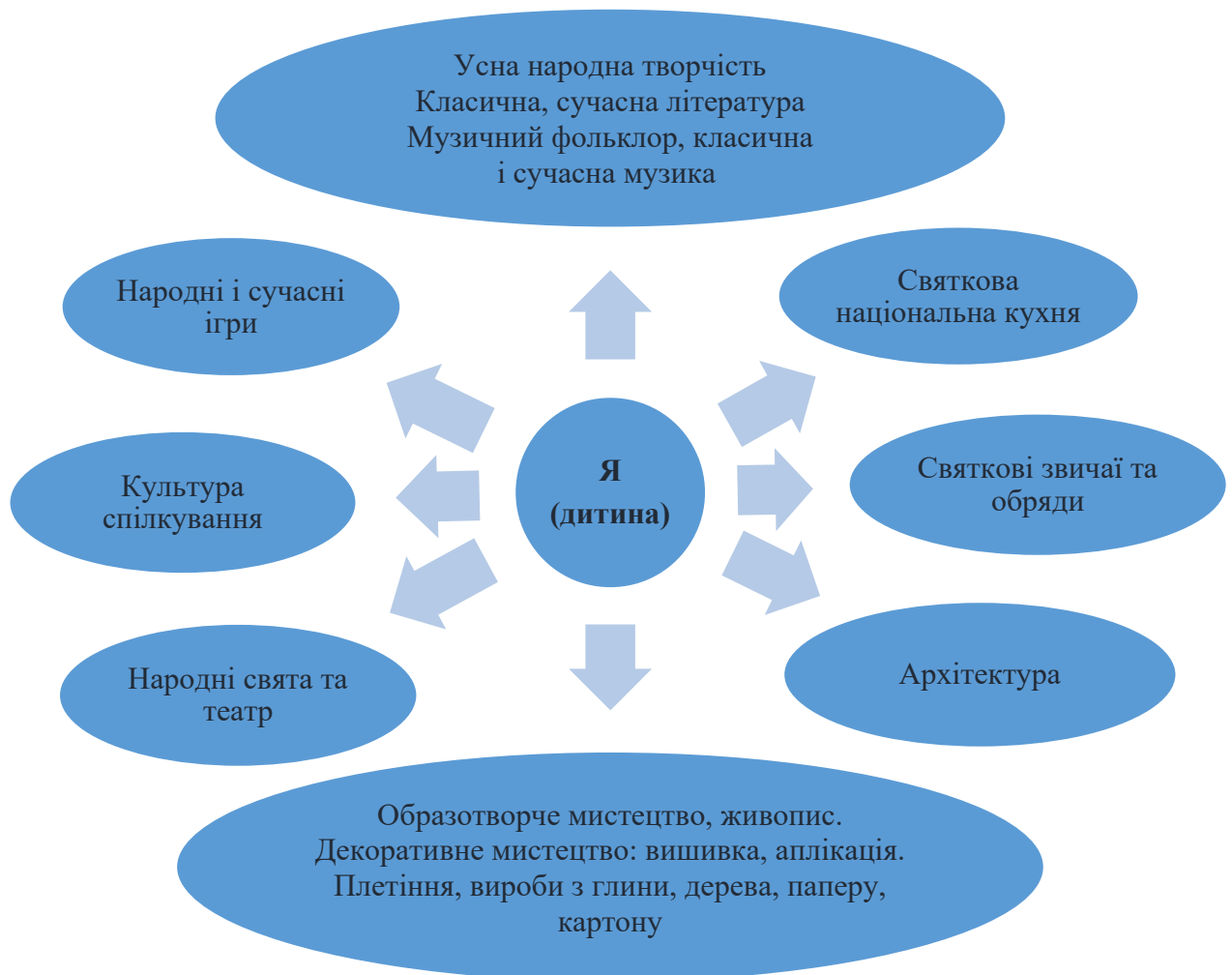
Рис. 2.1. Система уявлень дитини про регіональну культурну спадщину.

Виховання дитини відповідно до національної культури ґрунтується на принципах народної педагогіки, які визначають пізнання і практичне освоєння культурної спадщини її малої Батьківщини. Діти різних національностей знайомляться з культурою свого народу і культурою дітей іншої національності, які знаходяться в їх колективі. Педагоги разом з батьками розказують про особливості свят, народних костюмів, звичаїв, традицій, ігор, національної кухні їх народу. Діти досягають простої закономірності: як добре, що є різні народи, і є різні пісні, ігри, казки, прислів'я тощо. Зміст цього напрямку виховної роботи представлений на рис. 2.1.